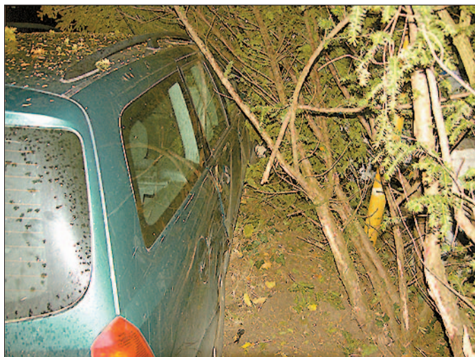
Büsche und eine Mauer stoppten diesen Pkw.