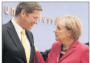
Einig: Kanzlerin Angela Merkel und FDP-Chef Guido Westerwelle.